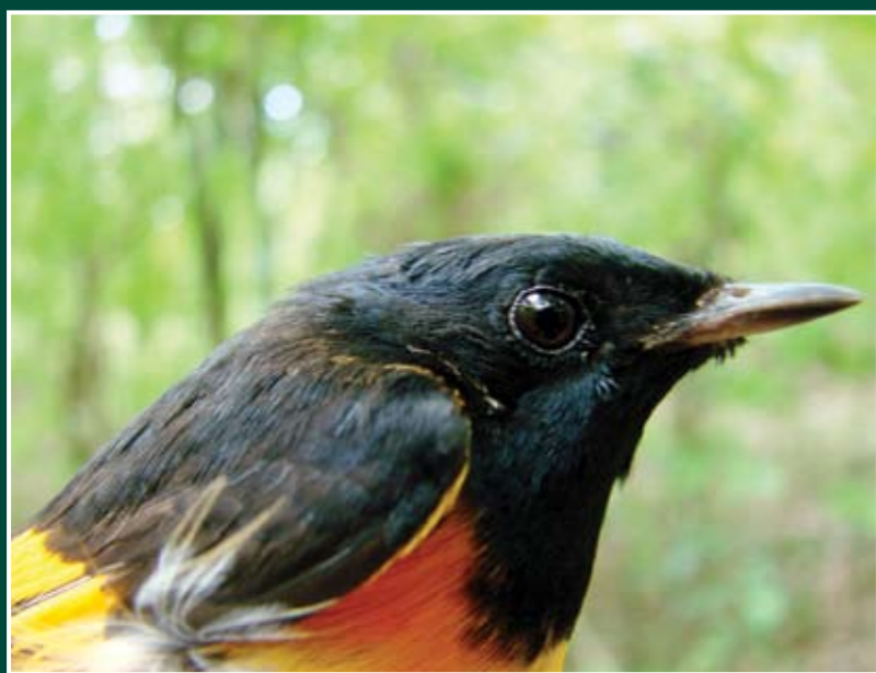
Setophaga ruticilla ♂ Candelita Norteña