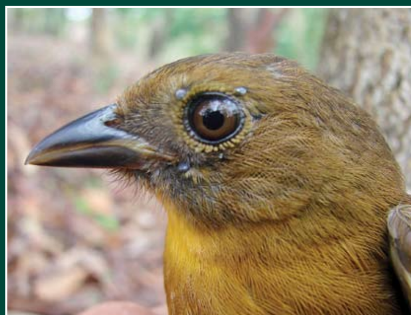
Habia fuscicauda ♀ Tángara Hormiguera Gorgirroja