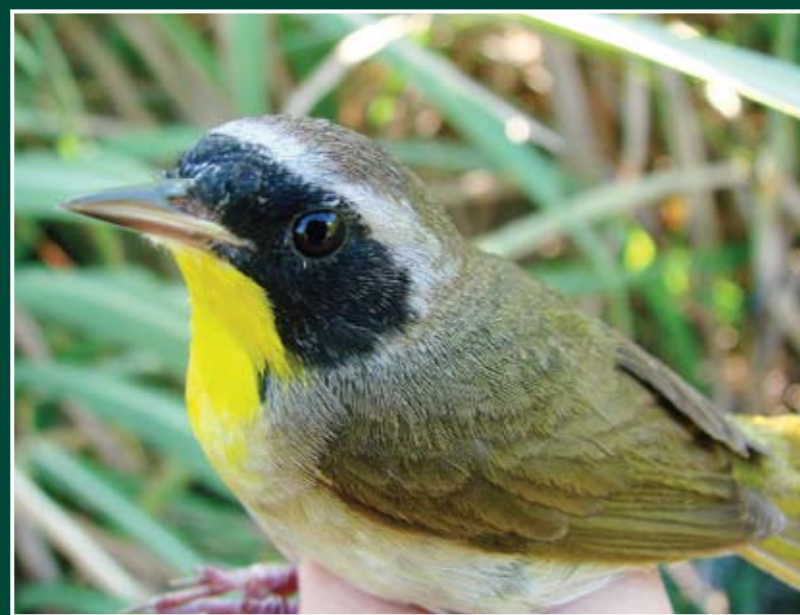
Geothlypis trichas ♂ Antifacito Norteño