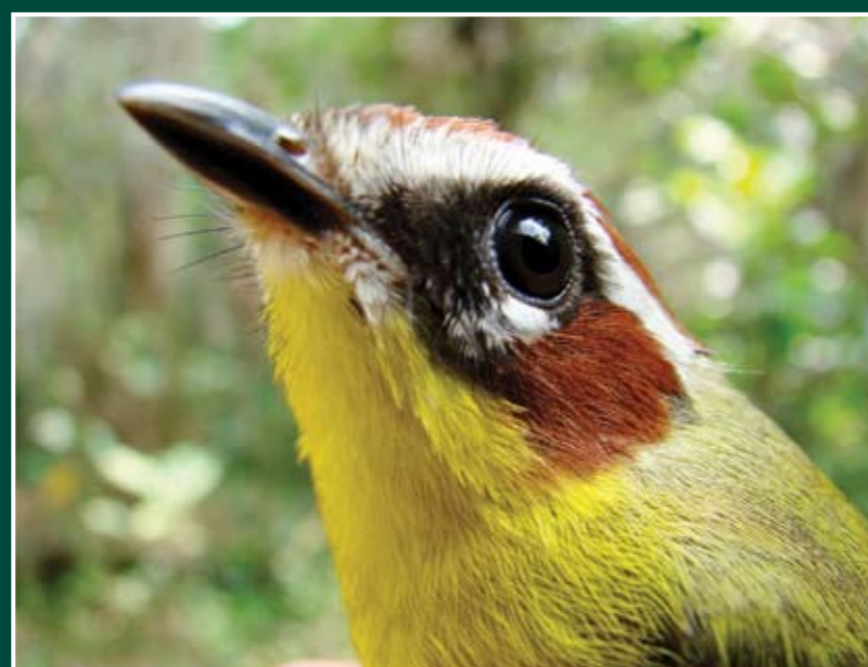
Basileuterus rufifrons Reinita Cabecicastaña