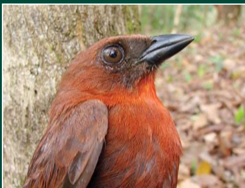
Habia fuscicauda ♂ Tángara Hormiguera Gorgirroja