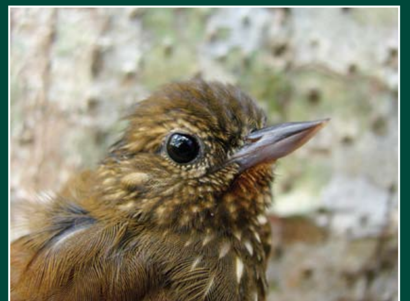
Glyphorhynchus spirurus Trepatronco Picocuña