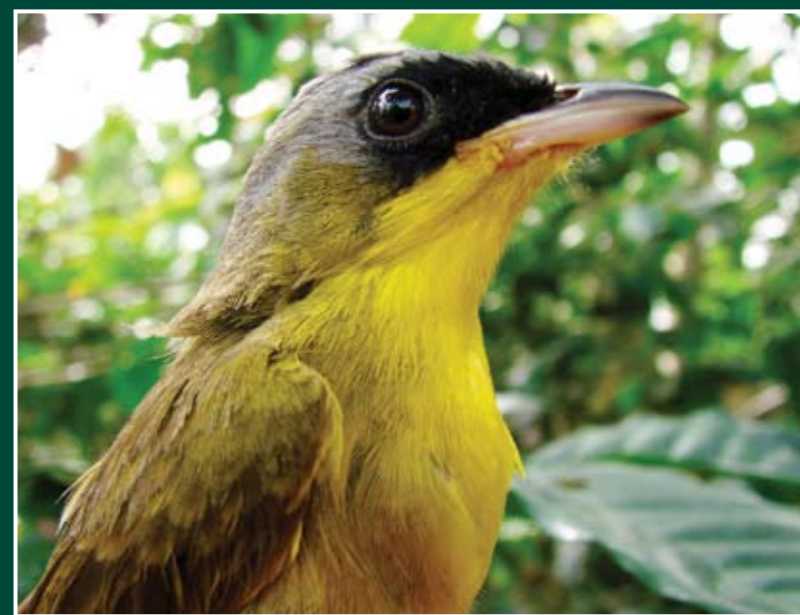
Geothlypis poliocephala ♂ Enmascarado Coronigrís