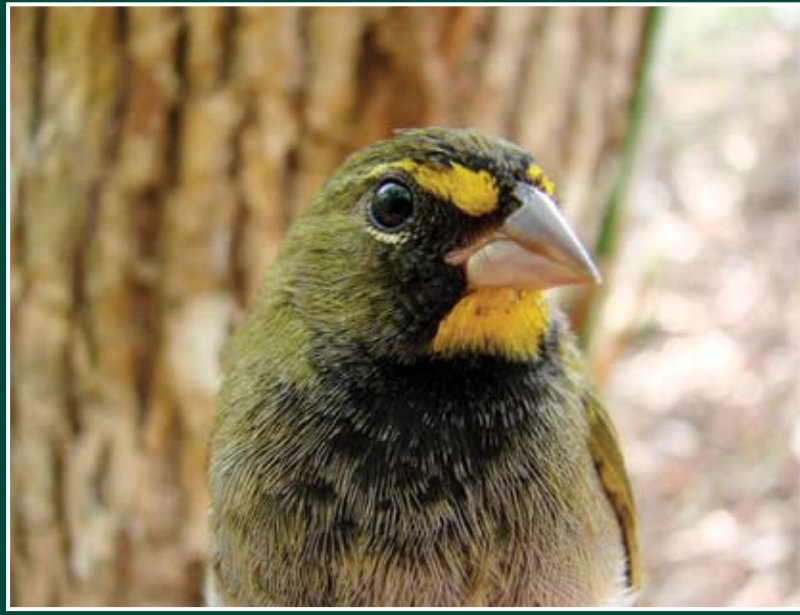
Tiaris olivacea ♂ Semillerito Cariamarrillo