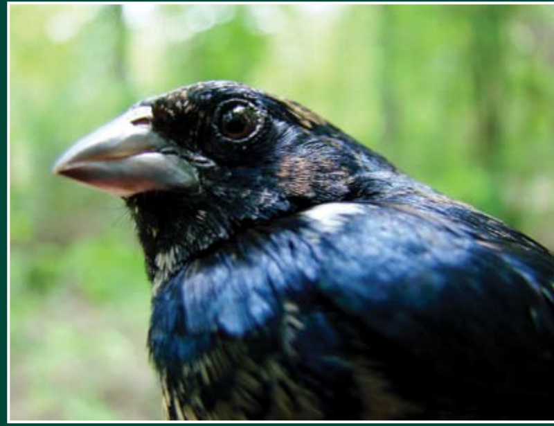
Volatinia jacarina ♂ Semillerito Negro