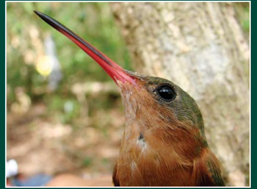
Amazilia rutila Amazilia canela