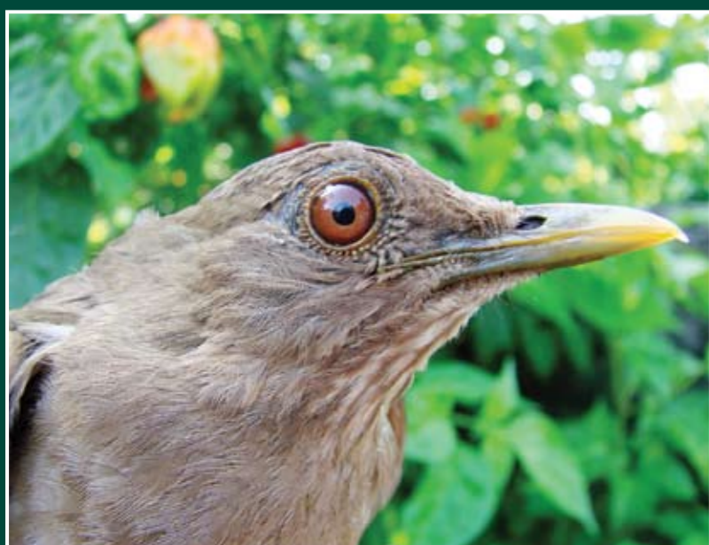
Turdus grayi Sensontle Pardo