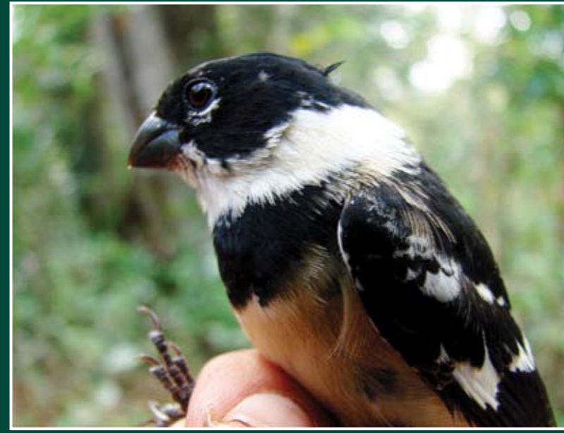
Sporophila torqueola ♂ Espiguero Collarejo