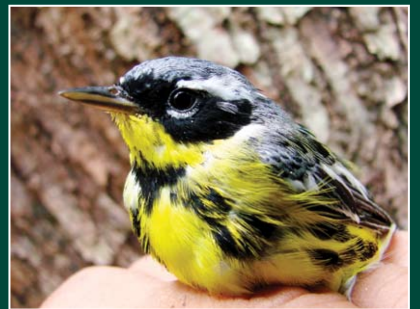
Dendroica magnolia ♂ Reinita Colifajeadá