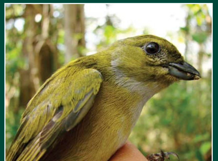
Euphonia hirundinacea ♀ Eufonia Gorgiamarilla