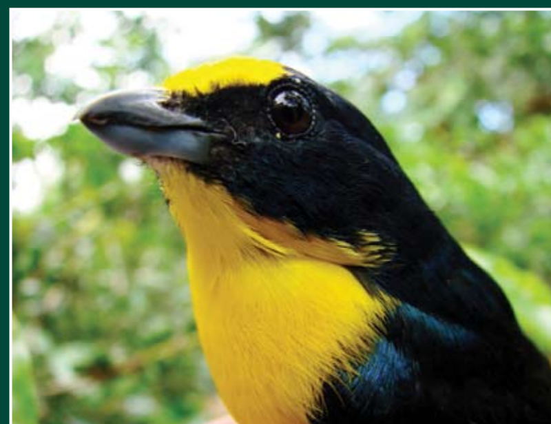
Euphonia hirundinacea ♂ Eufonia Gorgiamarilla