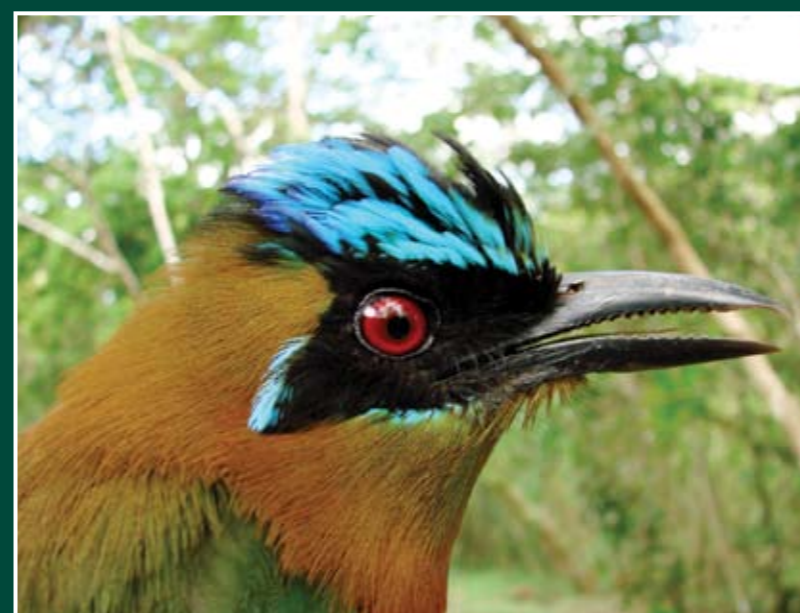
Momotus momota Guardabarranco Azul